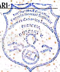
Secretaria, C.C. No. 29.538.148 DE GUACARI